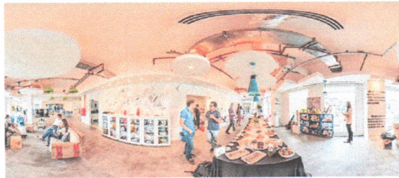
Exemplos de salas de aula inovadoras a serem montadas com investimentos do Senac no programa

em salas de aula inovadoras, tecnológicas educacionais – com ênfase em objetos digitais de aprendizagem, a fim de proporcionar maior sustentação à implementação de educação flexível – e demais projetos inovadores. A segunda linha trata-se da Modernização das Unidades do Senac, no que diz respeito aos projetos voltados à equalização da infraestrutura (projetos de engenharia e arquitetura, obras civis, fiscalização, mobiliário e equipamentos). No que diz respeito à implanta-