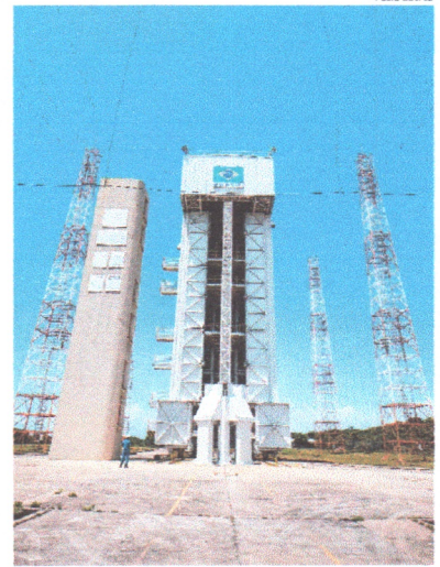
Centro Espacial de Alcântara tem Acordo de Salvaguardas Tecnológicas