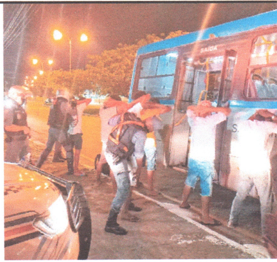
Operação da Polícia Militar em vários pontos da Ilha também tem abordagem ao transporte coletivo